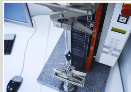
Esempi dei risultati di prova Micro Grip